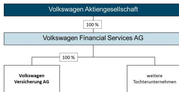
ABBILDUNG 1: ORGANISATORISCHE EINBINDUNG DER VOLKSWAGEN VERSICHERUNG AG

Im Rahmen der Erstversicherung betreibt die Volkswagen Versicherung AG Versicherungsgeschäft im Geschäftsbereich sonstige Kraftfahrtversicherung (Garantie- und Reparaturkostenversicherung) in den Märkten Deutschland, Frankreich, Großbritannien, Irland, Italien, Österreich, Polen, Schweden, Spanien und Tschechien. Das Erstversicherungsgeschäft wurde im Berichtszeitraum teilweise über die französische Niederlassung per grenzüberschreitendem Dienstleistungsverkehr gezeichnet.